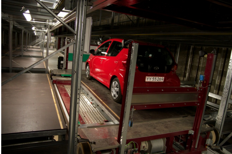
Foto 2: Bajo tierra: dentro del sistema automático de estacionamiento para vehículos en Copenhague